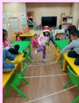
聖誕老公公送禮物