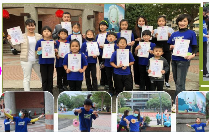
百善孝為先 五甲陳家好