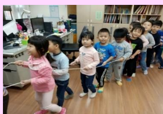
繩子變火車去旅行