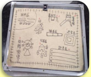
蓋小倉鼠遊樂區設計圖

小朋友從飼養照顧小倉鼠開始，除用報紙給予小倉鼠溫暖的家外，也會幫忙餵食、換水、對小倉鼠說說話，像小小孩照顧牠，直到我們因為教室工程搬到圖書館後，經歷小倉鼠逃亡記(自己跑出籠子)來到老師面前，於是乎再把牠放入籠子，驚嚇感謝還好發現牠出走，否則會上演尋鼠記，也因此小朋友紛紛討論如何讓小倉鼠不再出走，小朋友說:可以蓋一個小倉鼠遊樂場，遊樂場裡有迷宮、跑步區、溜滑梯、摩天輪旋轉樂樂區、球球區、盪鞦韆...等，還提議弄木板圍起來這樣小倉鼠才不會又跑走，希望透過照顧倉鼠愛的種子不僅能在他們心中發芽，還能不斷成長茁壯，讓幼兒學習尊重小生命，給予小動物有愛的小確幸。