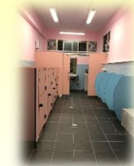
嶄新的幼兒園廁所