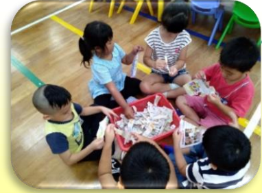
布置小倉鼠溫暖的家