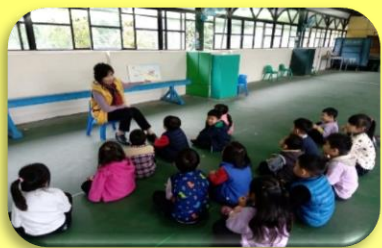
小朋友很專心聽故事