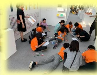
文青之旅-誠品書店與台北美術館