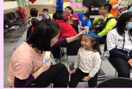
圖卡頭套親子遊戲