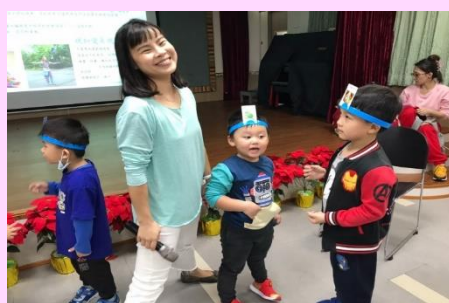
圖卡頭套遊戲示範

當天三項親子運動，不但好玩有趣，還能增加親子互動。活動一：利用圖卡頭套讓親子輪流猜出頭套上的圖卡是什麼？也讓家長和小朋友動動腦並藉由遊戲來增進親子情感交流。活動二：球的運動，透過投球、傳球等親子球類運動，可增進小朋友的體能及靈活度的發展。活動三：利用魔鬼氈球讓小朋友在遊戲過程中，鍛鍊孩子的手臂力量及手眼協調能力。總之，每天簡單輕鬆的親子運動，不只可以增進家人生活品質，培養全家愛運動的習慣，也將影響孩子一生的健康。