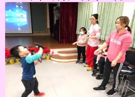
魔鬼氈球親子運動