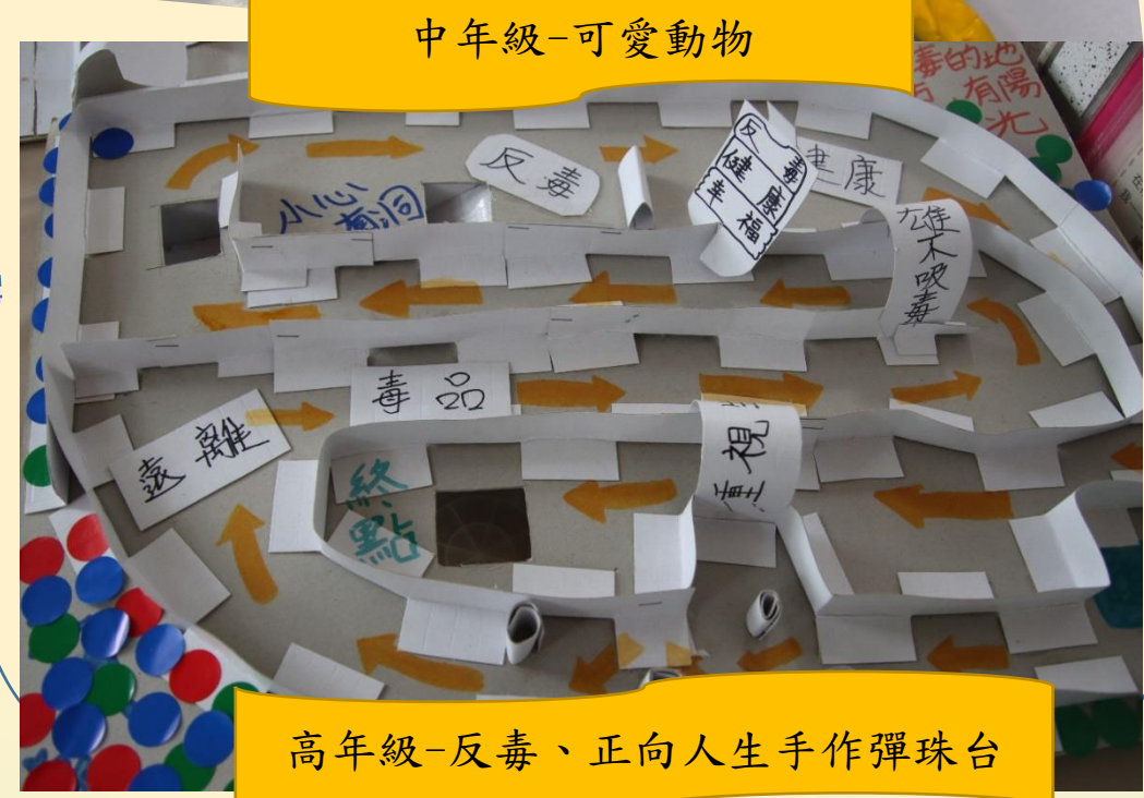
高年級-反毒、正向人生手作彈珠台